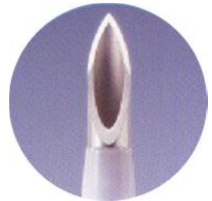
SURFLO đượ biết đến nhờ ĐỘ SẮC BÉN

Kim lều tĩnh mạch ngoại biên SURFLO của Terumo đượ thiết kế và sản xuất theo tiêu chuẩn chất lượng toàn cầu nghiêm ngặt, bao gồm tiệt trùng bằng chùm tia điện tử và tiêu chuẩn quản lý chất lượng ISO/hệ thống mã màu đặc biệt, giúp sử dụng dễ dàng, chắc chắn và an toàn hơn.