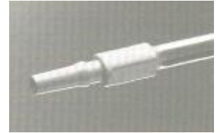
Kết nối Luer slip