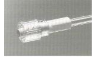
Kết nối Luer lock